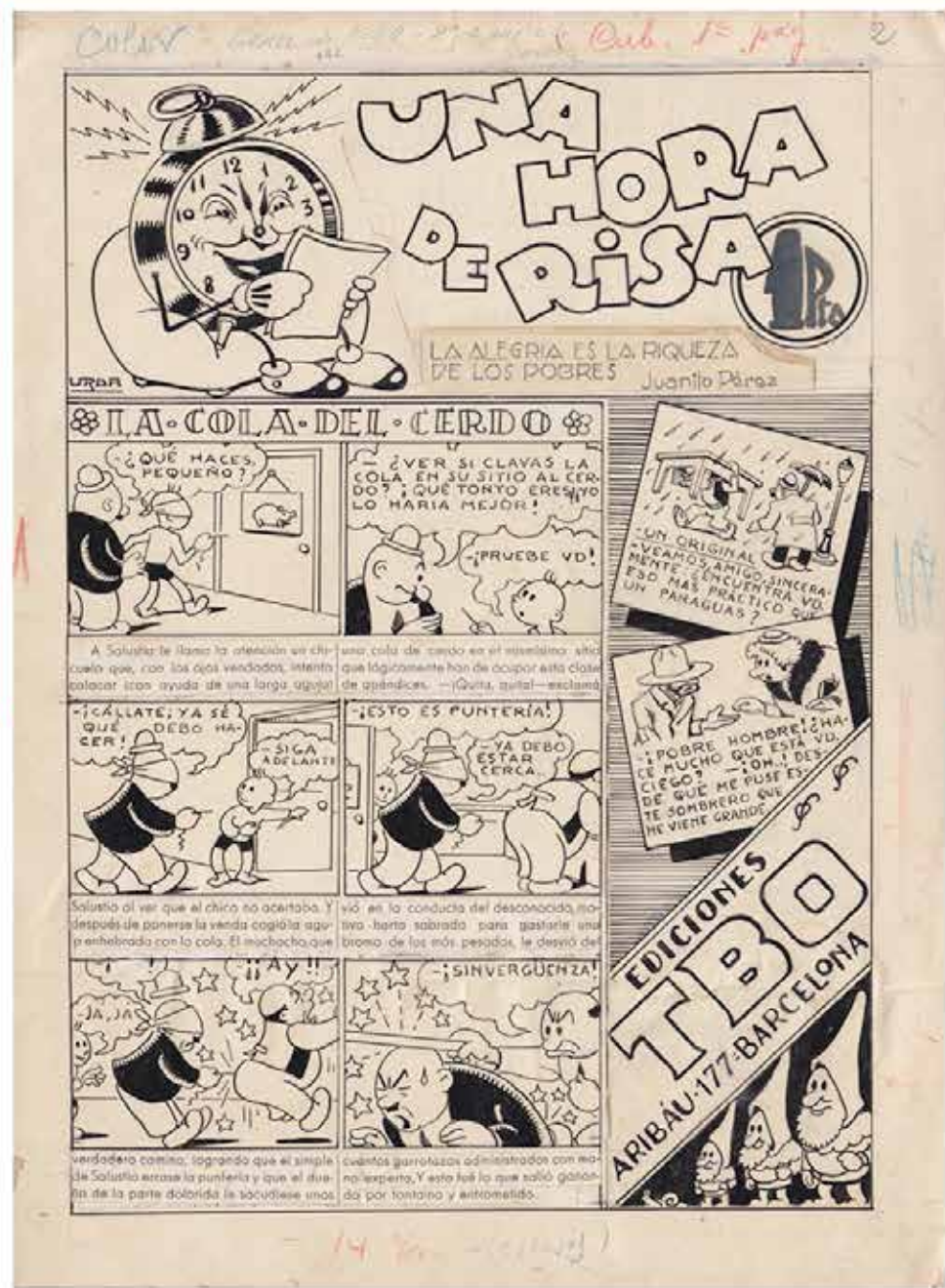
Foto 3.-Página 79 del libro “Los tebeos de la posguerra”, TBO que se publicó en enero de 1942 con el título “Una hora de risa”. Dibujo original de Manuel Urda Marín