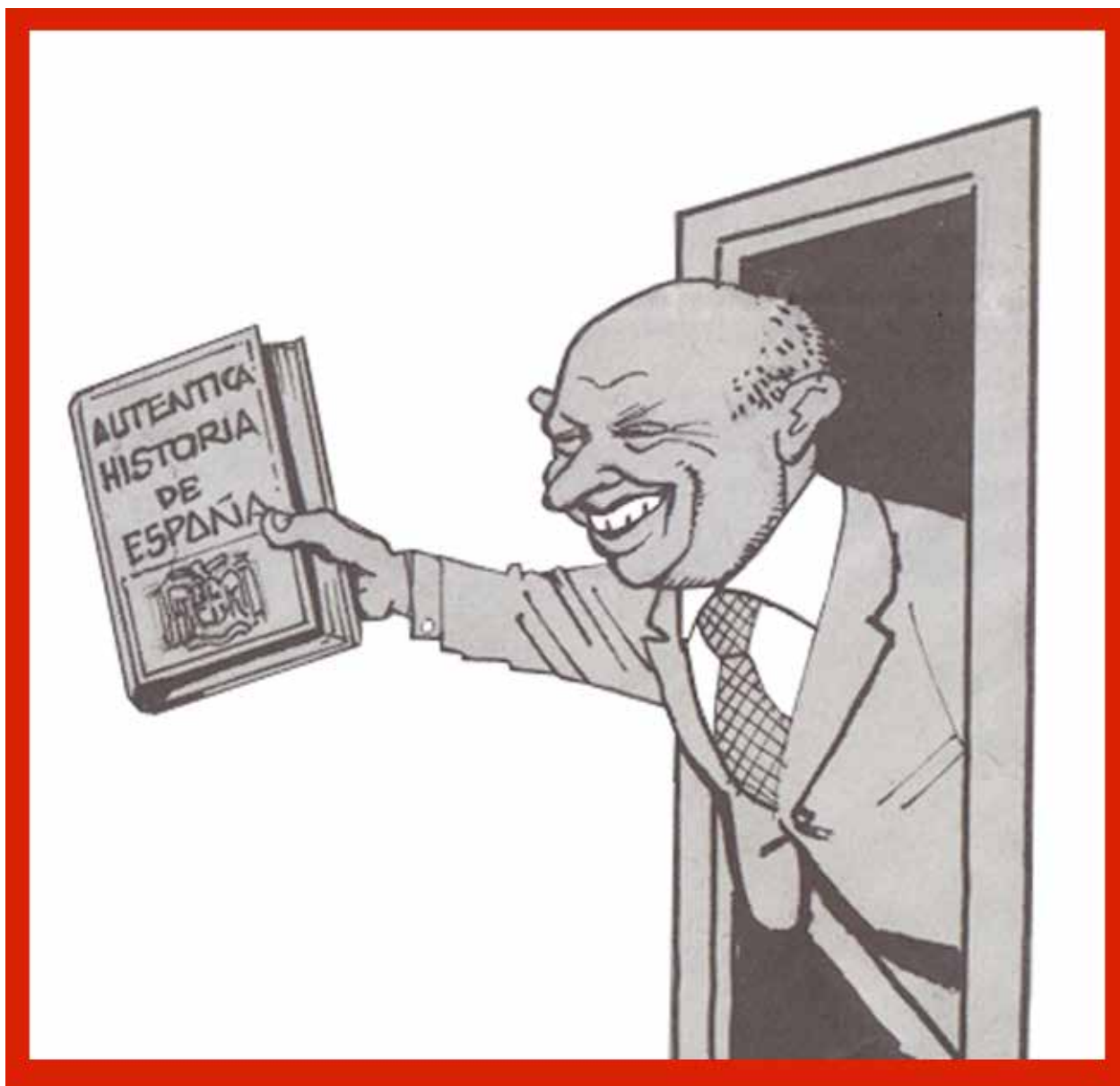
Foto 6.- Fragmento de la viñeta publicada el 20 de enero de 2014 en “ El Periódico de Catalunya ” en la sección diaria Animus Locandi realizada por el admirado Ferreres, donde la caricatura del Ministro Wert muestra “una” Historia de España, que supongo que es la misma que estudié en los años 50’ en el colegio nacional Francisco Franco, de la calle Bélgica. (actualmente Jardí) de Sabadell.