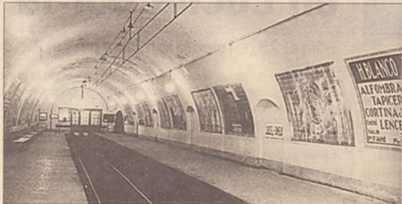
L'estació de Sabadell-Rambla als anys cinquanta