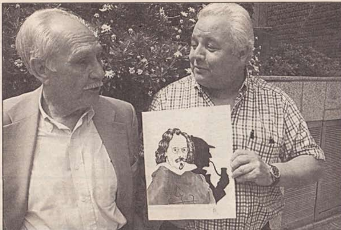
El logo de Giralt funde a Quevedo y Sherlock Holmes

«Nos conocemos por vínculos familiares y en cuanto me explicó el proyecto me apasioné y me dejé llevar», cuenta Giralt. Por su parte, Euge-